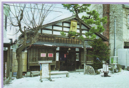
35 茶房菊泉 元町14-5 伝統的建造物 木造 大正10年