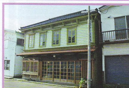
27 小森家住宅店舗 弁天町23-14 景観形成指定建築物 木造 明治34年