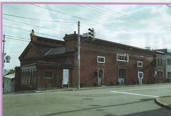
28 中華会館 大町1-12 景観形成指定建築物 煉瓦造 明治43年