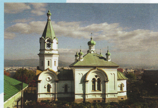
22-1 函館ハリストス正教会 元町3-13 伝統的建造物 煉瓦造 大正5年