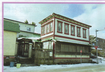
1 山内家住宅 船見町9-9 景観形成指定建築物 木造 大正11年