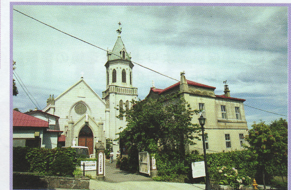
40-1 カトリック元町教会聖堂 元町15-30 伝統的建造物 煉瓦造 大正13年