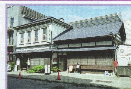
2-1-2 古稀庵・古稀庵附属土蔵 末広町13-2 伝統的建造物 木造/RC造 明治42年