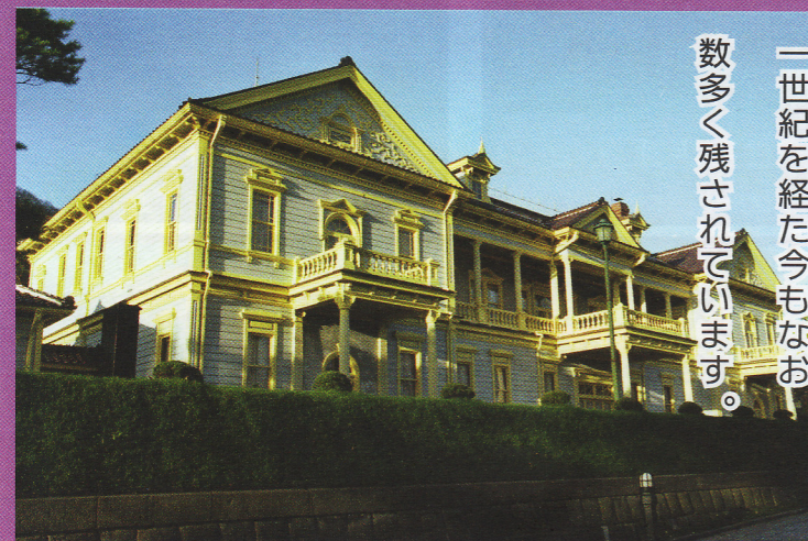
31-1 旧函館区公会堂 元町11-13 伝統的建造物 木造 明治43年

函館は海峡の激流がつくりだした海のまち。港町の歴史は、海から始まる。江戸末期の黒船来航とその後続く文明開化。急速な時代の流れに戸惑いながらも、異国の文化を貪欲に吸収し、独自の文化として昇華させた人々。函館にはそんな開港の歴史を物語る貴重な町並みが、一世紀を経た今もなお数多く残されています。