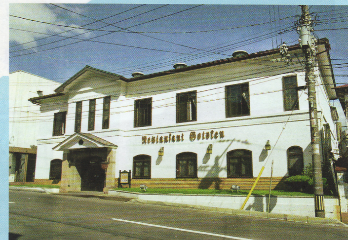
36 五島軒本店旧館 末広町4-5 景観形成指定建築物 木造 昭和9年

このような指定建造物等を良好な状態で末永く後世に伝え残していくために西部地区歴史的町並み基金を設置し、歴史的町並みの保全に役立てています。