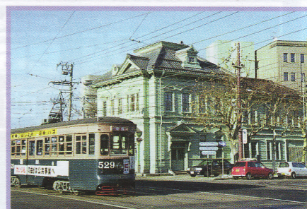
58 相馬株式会社 大町9-1 伝統的建造物 木造 大正2年