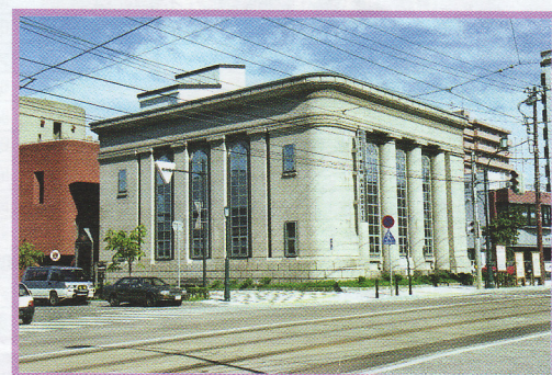
43 ホテルニュー函館 末広町23-9 景観形成指定建築物 RC造 昭和7年