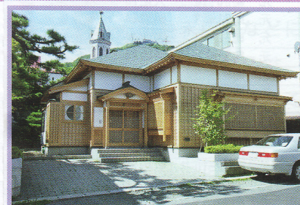
37 磯田家住宅 元町15-23 伝統的建造物 木造 昭和元年