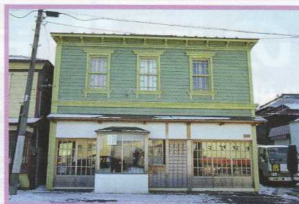
19 岩崎家住宅店舗 弥生町8-16 景観形成指定建築物 木造 大正13年