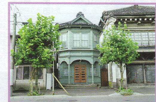
25 太刀川家洋館 弁天町15-15 景観形成指定建築物 木造 大正4年