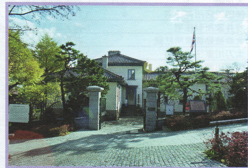
57 開港記念館(旧イギリス領事館) 元町33-11 伝統的建造物 煉瓦造 大正2年