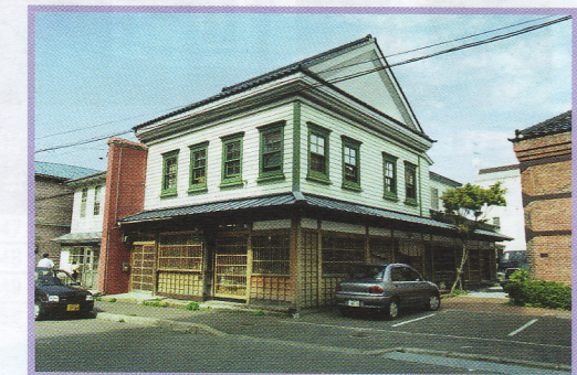
8 ザ・グラススタジオ函館2号 末広町14-2 伝統的建造物 木造 明治41年