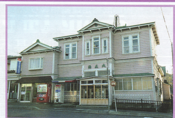
20 大正湯 弥生町14-9 景観形成指定建築物 木造 昭和3年