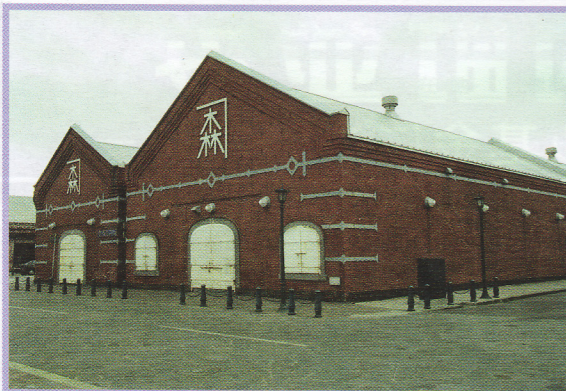
3-4 金森倉庫1号・2号 末広町13-8/13-16 伝統的建造物 煉瓦造 明治42年